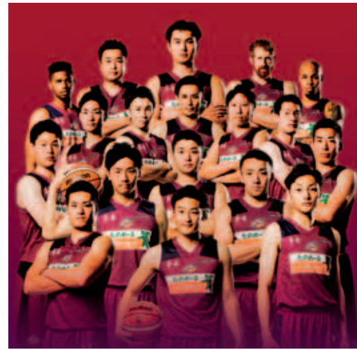
大塚商会アルファーズの選手

大塚商会アルファーズは、大塚商会のバスケットボール部として平成9年1月11日に創部しました。