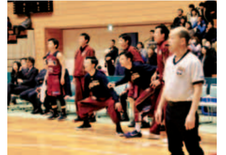
ベンチで声をかける選手たち

このチームは仕事とバスケットボールを両立することをモットーに活動していて、「明るく、前向き」で、何よりも「チームワーク」が一番の強みだそうです。