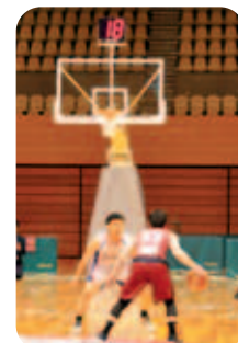
ゴール上にある電光掲示板に、残りの秒数が表示される

攻めているチームは、ボールを取った時点から24秒以内にシュートを打たなければなりません。