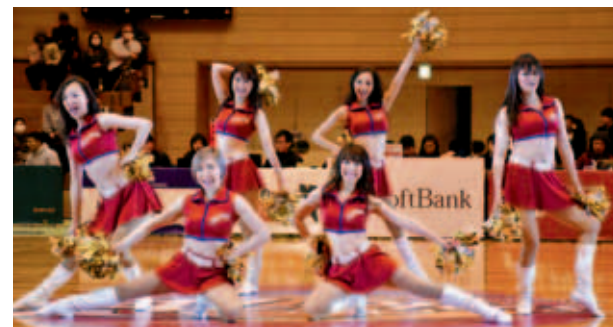
アルファビーンズのセクシーな応援も見どころのひとつ

恥ずかしがらずに大きな声で応援しましょう。どんな年代の方にも熱くなる時間を過ごしてほしいと思います。みんなで家族のように一体となり一緒に楽しんでもらいたいです。ぜひ試合会場にお越しください。