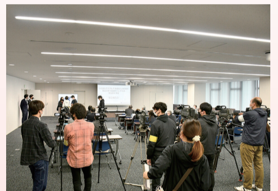
ドラマ撮影の様子