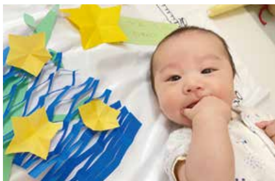
子育て世帯を応援します

周知方法は、対象者が令和5年4月1日以降に出生した児童の保護者であることから、出生届提出時の窓口での周知を考えている。なお、事業決定前に出生している子の保護者には通知を送付していきたいと考えている。