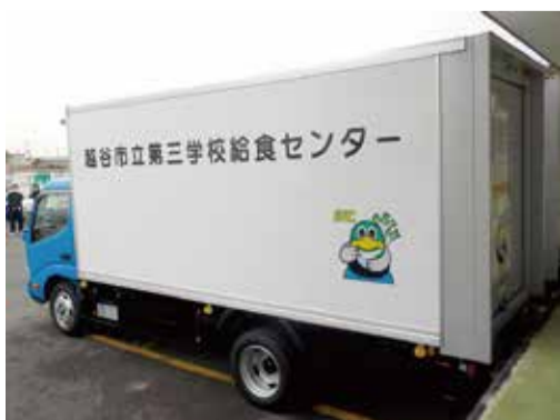
現在使用されている学校給食配送車

答 購入予定の車両には保冷機能が付いており、20度から32度の温度調整が可能となっている。また、保冷機能が付いていない既存車両15台については、順次買い替えを行っていく予定である。