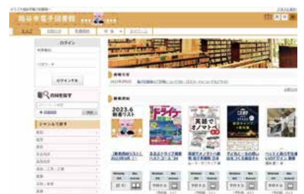
越谷市電子図書館のトップページ

また、電子図書館は、図書カードをお持ちで、市内在勤・在住・在学の方は、市ホームページから誰でも利用することができる。