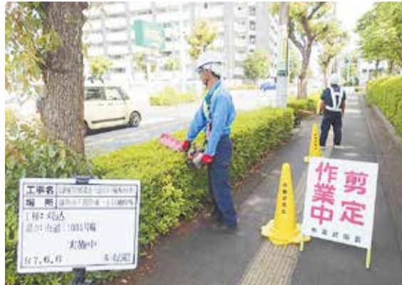
街路樹のせんてい作業

答 街路樹等管理委託により、60センチから80センチを基準に、年1回刈込等を行っている。また、刈込後の作業報告は、職員の立ち会いや写真提出に加え、測量機器を用いた刈込前後の写真提出の試みを行っている。