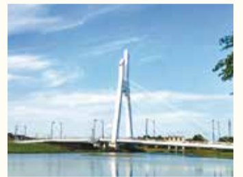
令和6年▶8月1日号表紙写真