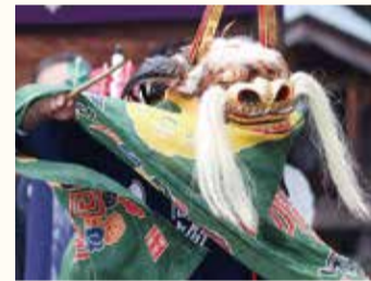
◀令和7年8月1日号表紙写真