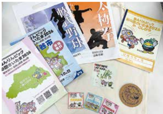
ねりんピックの啓発グッズ

答 啓発グッズの製作のほか1年前イベントに市のブースを出展した。また、経済波及効果について、先催県では全体で約100億円の効果があり、選手の購買意欲も高いと伺っている。特産品の販売やキッチンカーの出店などによる経済波及効果を期待している。