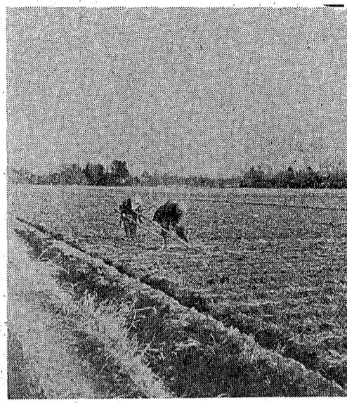
(いま麦の手入れにせむしい農家)

で、組合運営の基礎がたまた ら、財政規模が強大となるので いろいろの業務費が相当節約 できる 、損害防止を徹底的に実施で きる 、施設も整備統合されるので その施設を十分活用できる 、資産が集中され大きくなる ので、よりよい組合の運営が できるようになる 、役員職員についても、広い