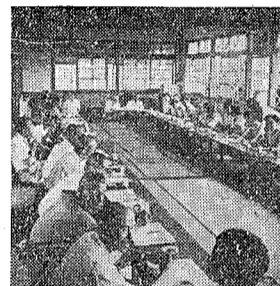
公民館長会議の様子