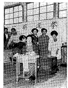
あなた自身で選挙の準備を済ませておきましょう。

○地方選挙期日決。地方選挙の期日は、昭和三十三年四月二十三日です。選挙の心得として、市民は、選挙の期日を厳守し、投票所へ行って投票してください。選挙の心得として、市民は、選挙の期日を厳守し、投票所へ行って投票してください。