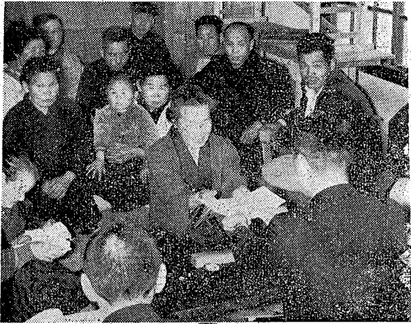
写真は老令年金証書の交付を受けるおとしより浦生公民館で

三月ともなれば、入学や卒業などを迎えるお子さんをもつご家庭では何かとお忙しいことでしょう。特に四月にはじめて小学校一年生として入学するお子さんをもつご家庭においては、何かやかと気をはって準備をしておきたいと思いませんか。 ……まず親として一番心配されるのは、いままで親のそばで自由な生活してきた環境と変わってくるので、果して学校生活になれるようになるにはどうしたらよいかということでしょう。 ……いま入学日前には、一日入学とか、児童の健康診断などで学校に行く機会が多くなるので、集団生活はなれてきていることにより、なるべく規則正しい生活になるよう、自分でできることは自分でできるようにいまいまから十分つけておくことが大切です。 ……学校でやった健康診断の結果、果して歯や、耳、眼などの病気の有る児童は先生のいわれたとおりの入学日までにはおさずようにしておきましょう。 ……お許りに教科書がわたされ