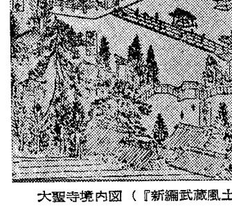
大聖寺境内図(『新編武蔵風土記稿』から)

それ料理屋が五、六軒ほど並び、左手には天神地蔵など、もろもろの小社が建てられている。また不動堂の北方に越谷に通じる裏門があり、その東方にも築地地帯に通じる裏門があるが、これらの門前にも旅籠屋や商家が軒をなべている。さて、不動堂の周囲には此がつけられた八角四方の勾欄(廊下につけられたらんかん)がつけられ、雨の日でも参詣人は足や衣服を濡らす事なく参詣できるように作られているのは、成田の不動堂と変わりはなく、成田の不動堂には、寺院の紋章が彫り込まれており、その内陣は荘厳のきわみである。また本堂の周囲には男女女の齋(たぶ)が数多く納められており、その不動信仰の深さが思い知らされる。さらに室内には文祿・慶長・元和・寛永年間奉納に於ける馬なども掲げられて