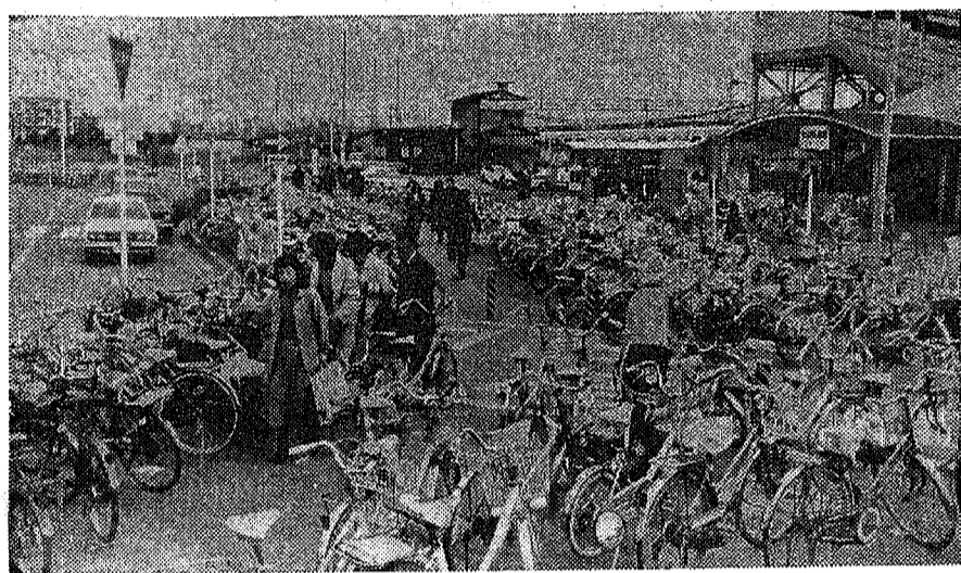
「自転車放置日本一」の汚名をつけられたせんげん台駅西口—午前8時

大部分が通勤や通学に利用 市内の駅前周辺に放置された自転車は、大部分が通勤や通学に利用されている。調査によると、全体の約7割が通勤・通学用で、残りの3割が趣味や娯楽用などである。また、放置された自転車の多くは、壊れているものや、盗難されたものも少なくない。市民は、放置された自転車を発見したら、すぐに警察に届報するよう呼びかけられている。