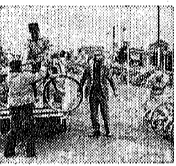
北越谷駅北側の無料自転車駐輪場

北越谷連合自治会は、駅前周辺に放置された自転車を撤去し、駅前周辺をきれいにしました。この取り組みは、市民の生活環境を改善し、交通安全を確保するために実施されました。