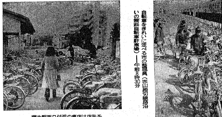
蒲生駅西口付近の商店は店先をふさがれる—午後1時

「放置された自転車が、駅前周辺を汚すだけでなく、通学や通勤の妨げにもなっている。また、盗難の被害も少なくない。市民は、放置された自転車を発見したら、すぐに警察に届報するよう呼びかけられている。」