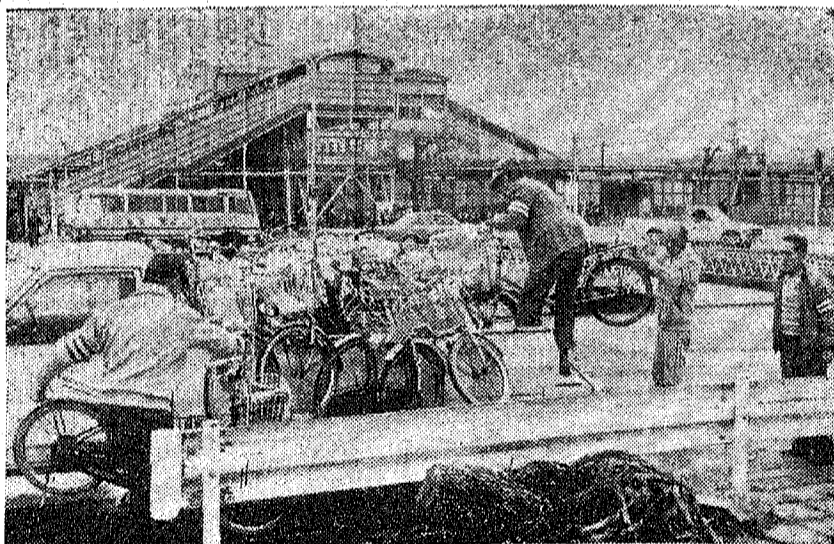
無責任に放置された何十台もの自転車やオートバイをトラックに積み上げるのは並大抵の苦勞ではない—北越谷駅西口、午前7時

「私たちは、駅前周辺に放置された自転車を撤去し、駅前周辺をきれいにしました。この取り組みは、市民の生活環境を改善し、交通安全を確保するために実施されました。」