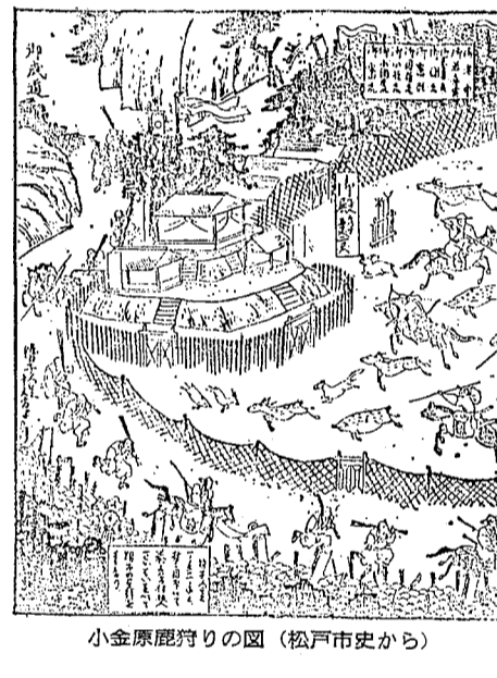
小金原鹿狩りの図(松戸市史から)