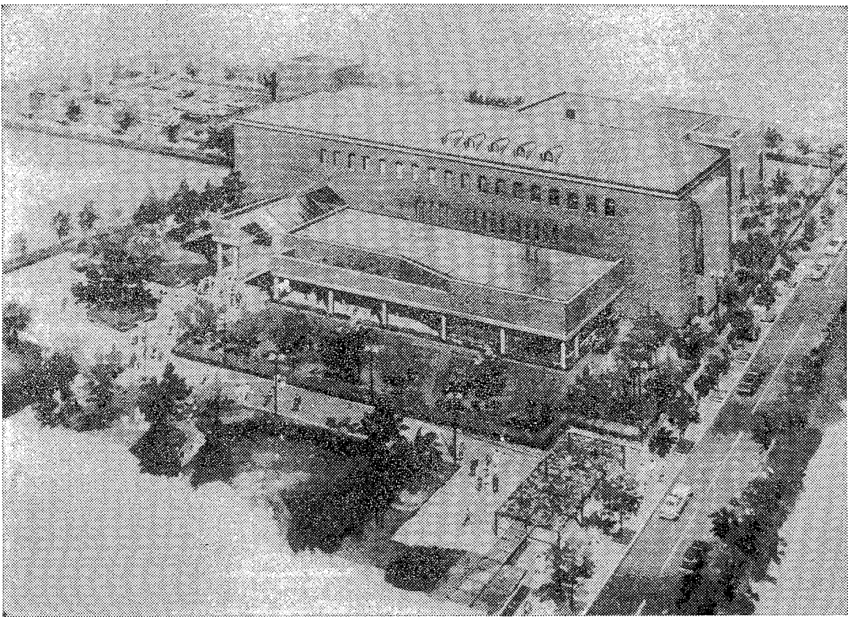
▲市立図書館完成予想図

市民に開かれた気軽に利用できる図書館、くらしのなかの図書館が58年4月に開館します。この図書館は、輝く太陽のもと、施設を中心に樹木をめぐらし、南面に広く庭園を配しているなど、「みどりのなかの図書館」にふさわしいものです。