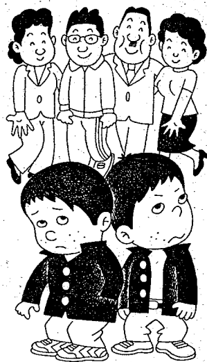
地域ぐるみで青少年を非行から守りましょう