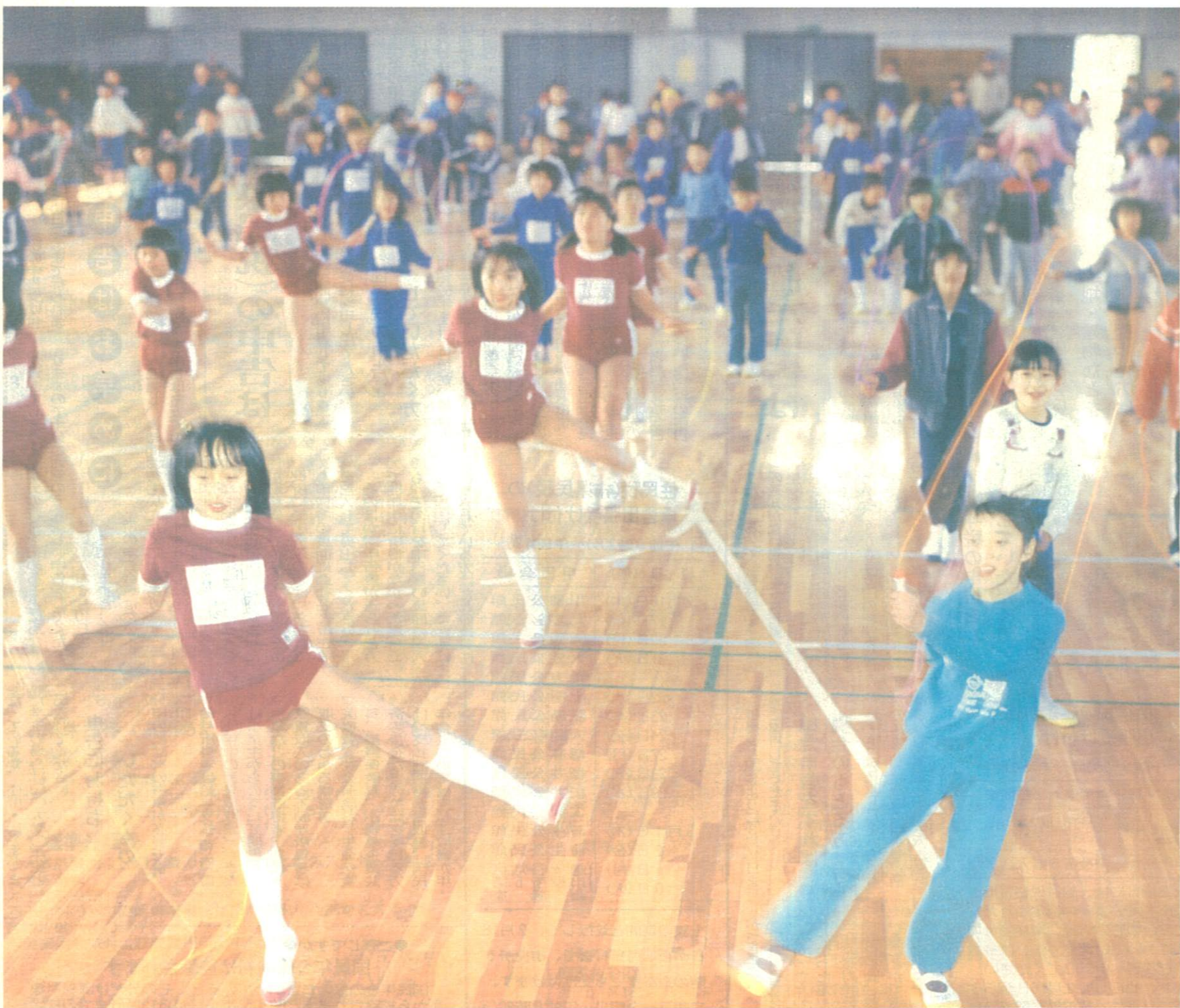
第2回越谷市なわとび大会が、2月5日、市立第一体育館で開かれました。競技は「二重とび」と「時間とび」の2種目で記録が争われ、二重とびでは314回(小学5年男子の部)、時間とびでは50分10秒(小学4年女子の部)などの好記録が出ました。なわとびはだれでも簡単にできるスポーツ、あなたも何回とべるか挑戦してみてください。