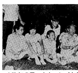
▲昨年のワークキャンプから

8月17日 (金) ~ 19日 (日)。山梨県清里高原キャンプ場。対象は野外活動に興味のある小学3年生以上の児童、および一般青年男女。