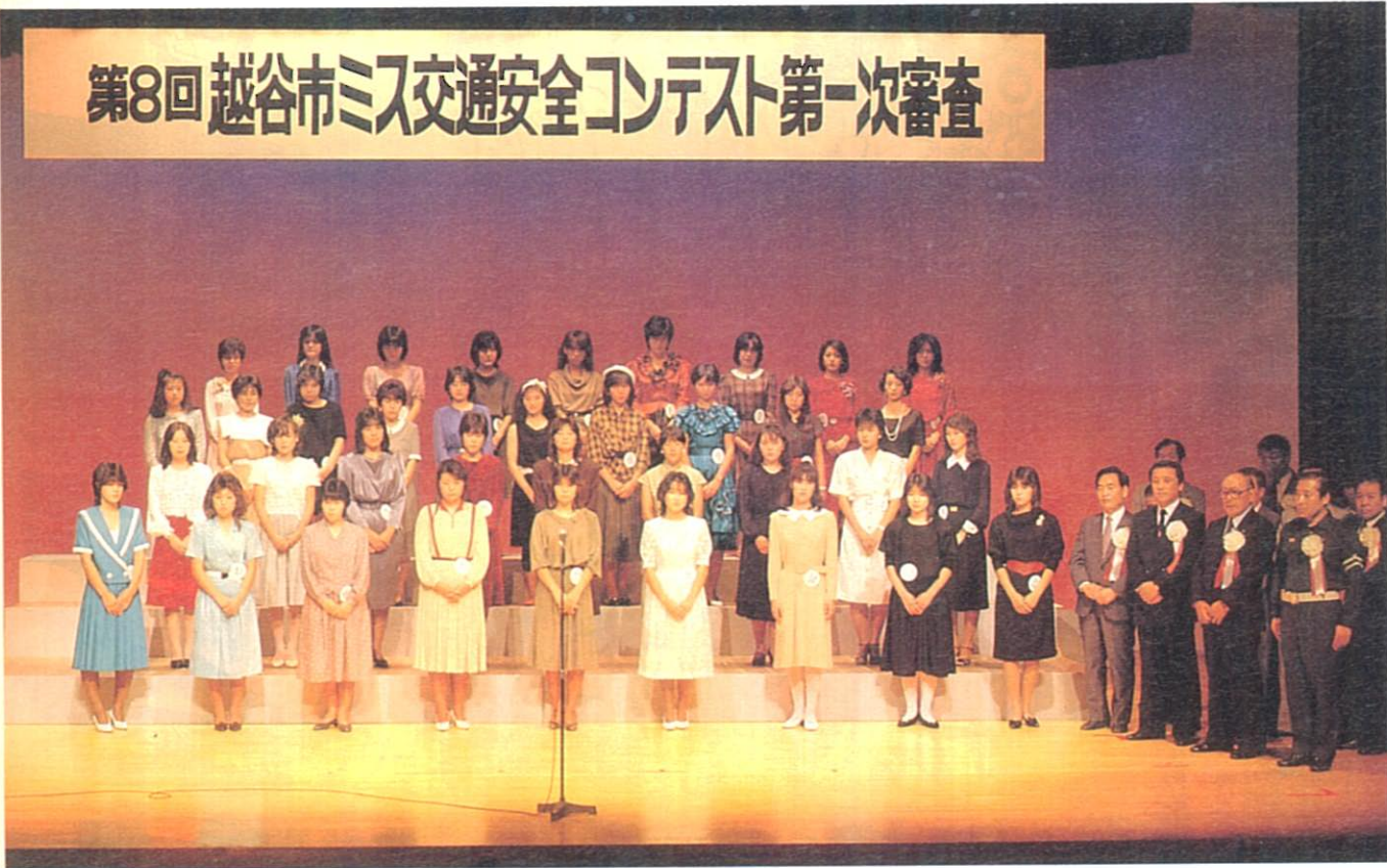
第8回越谷市ミス交通安全コンテスト第一次審査