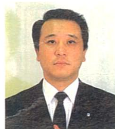
交通安全市民まつり 実行委員会委員長

出をつりながら、年ごとに大きな盛り上がりを見せております。 この市民まつりに、市民ひとりひとりのみなさんが主役で参加され、心と心のふれ合いで、人と車の調和をはかり、明るく住みよい文化都市をつくることを、念願しております。 この意義深い交通安全市民まつりの成功を願い、越谷市民のみならずの限りないご支援と、積極的なご参加をお願い申し上げます。