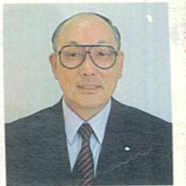
交通安全市民まつり 運営協議会会長