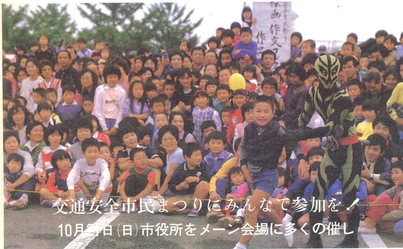
交通安全市民まつりにみんなで参加を！ 10月21日(日)市役所をメイン会場に多くの催し