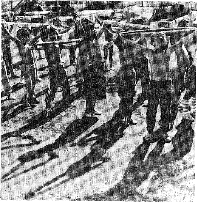
伸びゆく子どもたちに豊かな環境を

昭和60年度の市政を方向づける当初予算などを審議する3月定例会市議会が1日から開かれています。開会初日に島村市長は施政方針演説を行い、新年度の基本方針を明らかにしました。今号は、その演説の全文をご紹介します。