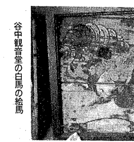
谷中観音堂の白馬の絵馬

越谷のれきし (108) 谷中観音堂の絵馬(えま)。このうち谷中の観音堂(かんのんどう)には、白馬が戦いで傷(きず)をついた鎧武者(よろいむしや)を背中に乗せて助け出すありさまをえがいた大きな絵馬が残されています。