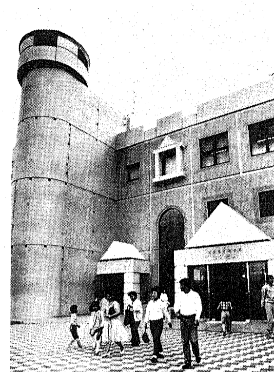
税金はわたしたちの暮らしを守る貴重な財源です (写真は児童館コスモス)

住民税(市県民税)、所得税、事業税の申告受け付けが2月16日(火)から3月15日(火)まで行われます。これは昨年1年間(62年1月12月)の所得を申告していただくものです。