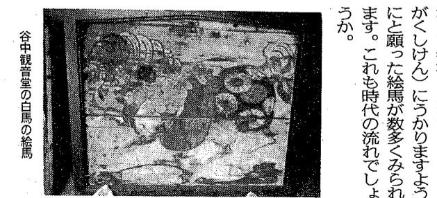
谷中観音堂の白馬の絵馬

越谷のれきし (108) 谷中観音堂の絵馬(えま)。このうち谷中の観音堂(かんのんどう)には、白馬が戦いで傷(きず)をついた鎧武者(よろいむしや)を背中に乗せて助け出すありさまをえがいた大きな絵馬が残されています。