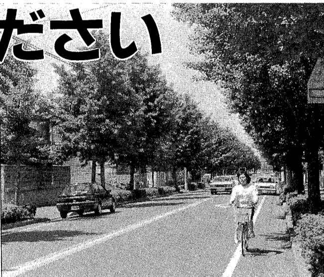
街路樹が美しい道 さて、この道にはどんな名前が?

道、は私たちの生活に深くかかわっています。通学、通勤するとき、散歩や買物をするときなど、いろいろな道を通っています。あの道にも、この道にもそれぞれの街の香りがするはず。緑の道や広々とした道、つつじの咲く道……。これらの道に皆さんで愛称をつけてください。そして、道を、街を身近に感じて、越谷をもっと愛してほしいのです。すてきな愛称をお待ちしています。