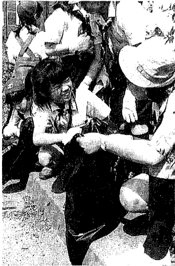
まちがきれいだと気持ちいいネ! (昨年のクリーン作戦から)