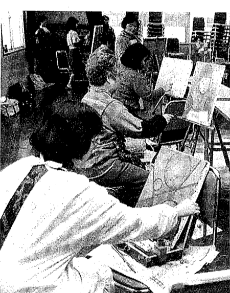
仲間との話らいも楽しみのひとつ