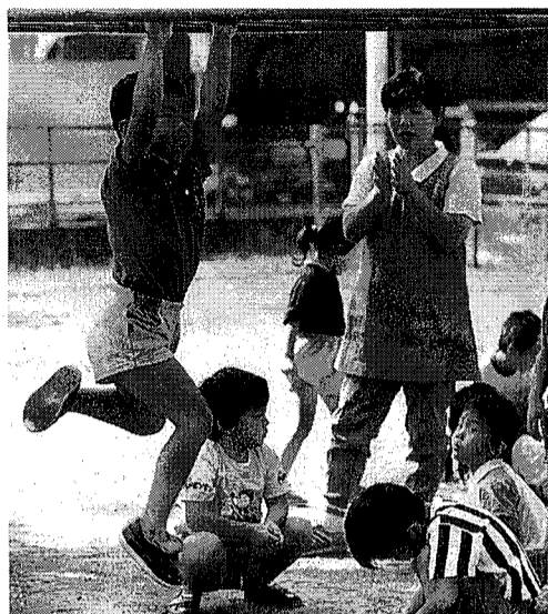
楽しい集団生活は子どもに自立心をはぐくみます