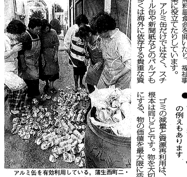
アルミ缶を有効利用している、蒲生西町二丁目目の「アルミ缶倶楽部」の皆さん

また、このように、燃えるゴミの中にアルミ缶が混ざると、燃えるゴミの燃焼温度が下がります。燃焼温度が下がると、燃焼が不完全になり、有害な物質が発生する恐れがあります。