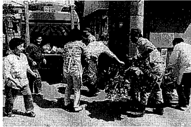
ごみは計画的にお出してください

この時期にはごみの量が大量多くなるため収集時間が通常と異なる場合がありますのでご了承ください