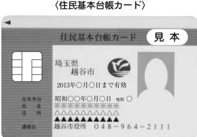
▲写真は、Bタイプ(顔写真入り)です。このほかにAタイプ(氏名のみが印刷されたもの)があります。いずれもICカードです

で交付できるもの(印鑑登録番号がカードに記載されたもの) ▽Bタイプ：印鑑登録証明書のみの自動交付機で交付できるもの ▽Cタイプ：住民票の写しのみ自動交付機で交付できるもの *市外へ転出した場合は無効になります