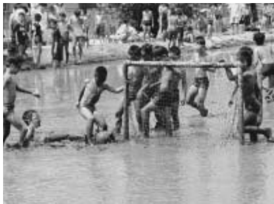
どろの中のプレー

参加した子どもは「初めてどろの中に入ったけど楽しかった。またやりたい」と話していました。