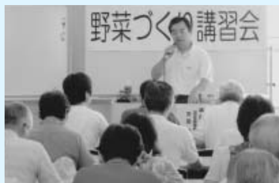
参加者からさまざまな質問が寄せられました

笛や太鼓に乗って軽妙な踊りを披露したのは、市内の企業、商店会、飲み仲間などの地元連に加え、本場徳島・東京高円寺からの招待連など71連(総勢約5000人)。