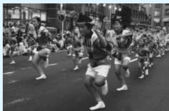
71連が日ごろの練習の成果を発揮

谷市社会福祉協議会・越谷市老人クラブ連合会の共催で行われ、市内在住の60歳以上の方90人が受講しています。