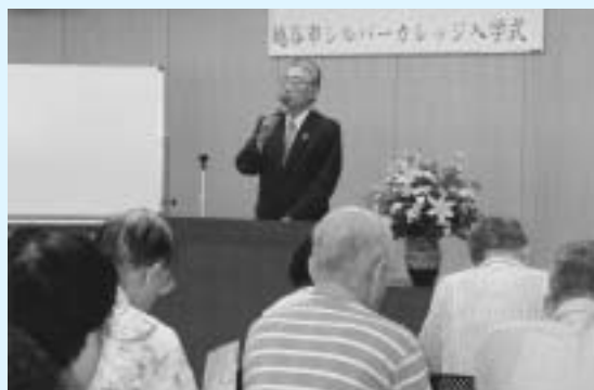
入学式に続き行われた板川市長による学長講話

入学式に続き、学長を務める板川市長が市の主要施策や財政状況について講話を行い、参加者は熱心に耳を傾けました。今後、11月24日まで計12回の講座が予定されていて、消費生活や健康、福祉、歴史など幅広い内容を学びます。