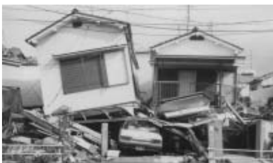
阪神・淡路大震災で倒壊した住宅

がきに、住所・氏名・電話番号・販売品目を記入し左記へ。応募結果は9月下旬に通知します ⑯越谷市民まつり実行委員会フリーマーケット係(☎343-8501) ⑰越ヶ谷4の2の1商業観光課内 ☎963-9191 ★模擬店出店者 ⑱営利を目的としない市内の市民団体(抽せん) ⑲2500円(県収入証紙)。事前に細菌検査が必要。⑳9月30日(木)までに印鑑をお持ちのうえ直接左記へ。説明会に参加していただきます(10月8日(金)、午後2時から。中央市民会館第13・14会議室) ㉑越谷市民まつり実行委員会(商業観光課内) ☎963-9191