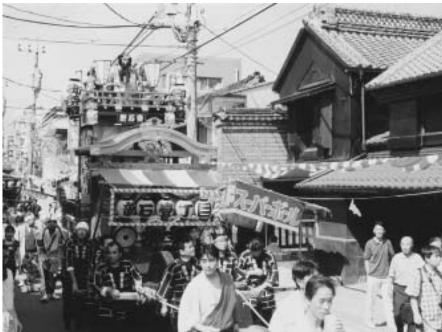
▲平成13年に行われた越ヶ谷まつりの様子

町内に到着した神輿は、本町一丁目、三丁目、中町、新石一丁目、三丁目、弥生町の各町内会の山車(だし)8台を出迎えられる、1列になって町を一回り