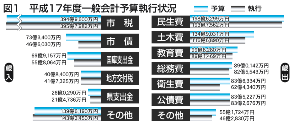
図1 平成17年度一般会計予算執行状況