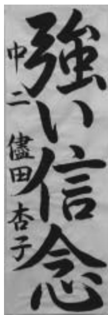
* 2年生のときの作品

養蚕を行っているところでした。最初は蚕がいやでまともな手伝いができませんでしたが、しばらく様子を見てみると、なんとなく蚕がかわいく思えてきました。触ってもクネクネするだけで、かみついたりもしないので手伝いが楽しくなってきました。そこでは蚕を大量に育てていたのですが、とくにエサやりは