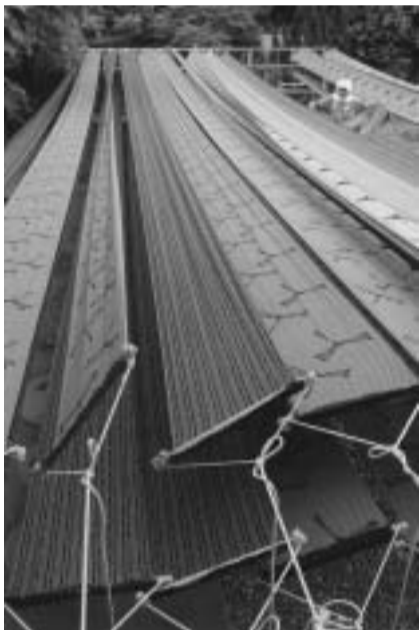
天気の良い日には、1日100枚の浴衣地が天日干しされています