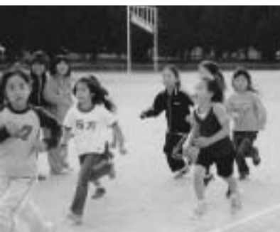
楽しい行事がいろいろ

ケーキが出来上がりました。カルタ大会は、練習が楽しみです。去年私は、読み札を全部覚えていて、地区優勝しました。でも、今年から新しいカルタに変わります。どんなカルタか楽しみです。他にも、いろいろありますが、これからも楽しく子ども会の行事に参加していきたいです。 * 次回は 大沢地区です