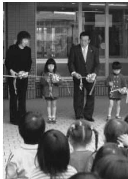
子どもたちによるテープカット

5月9日、地域子育て支援センターたけのこ(おおたけ保育園内)で、理事長や園長、園児ら約70人が参加して、テープカットが行われました。地域子育て支援センターでは、地域に開かれた保育所づくりを進めるため、一時保育をはじめ、子育て相談や講座、子育てサークルの育成・支援など、地域に根ざした子育て支援事業を幅広く展開しています。たけのこは市内3カ所目の地域子育て支援センター。