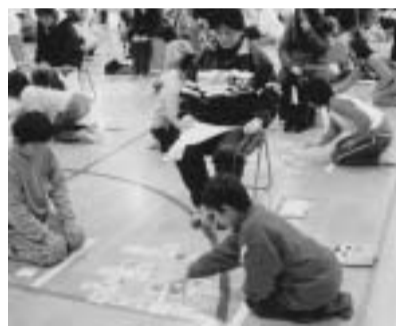
地区優勝したカルタ大会

私は、辻子ども会に入っています。私が毎年一番楽しみにしている事は、親子旅行です。去年は「スリゾートハワイアンズ」に行き