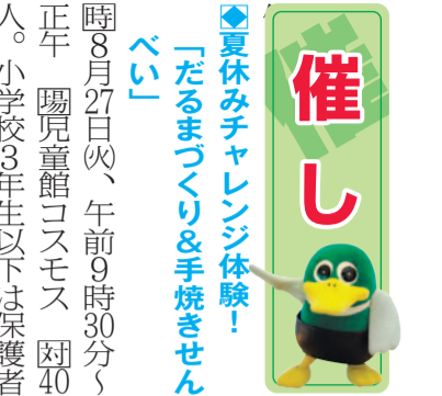
今年の新作の様子