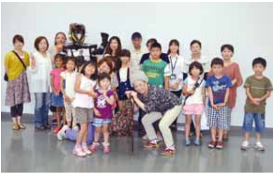
講座終了後にみんなで記念撮影(午後の部)

7月24日の午前と午後、科学技術体験センター「ミラクル」で、主に小学生を対象とした認知症サポーター養成講座が開催されました。これは、認知症について理解を深めてもらうために、「ミラクル」の協力を得て、地域包括支援センターが主催したものです。受講者は、ゲーム・紙芝居・お芝居を通じて、認知症の人や家族の気持ちを学びました。認知症サポーターとは、認知症を正しく理解し、認知症の人やその家族を温かく見守る応援者です。受講者は認知症サポーターの印としてオレンジリングを受け取りました。