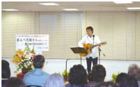
満員(90人)の観客が夕焼けコンサートを楽しみました

7月4日、越谷市男女共同参画支援センター「ほっと越谷」で夕焼けコンサート「あんべ光俊コンサート」が開催されました。毎年7月に「ほっと越谷」は七夕フェスタを開催し、各登録団体が講座や展示を行っています。その一環として、A・C「森の風」の協力のもと、「ほっと越谷」が主催したものです。あんべさんは、震災直後から避難所でミニライブなどを展開し、復興支援活動を続けています。懐かしいヒット曲や支援のための応援歌、計15曲が披露されました。被災地の現状についての話では、観客は耳を澄ませて聞き入っていました。