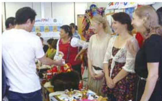
七夕の日に、さまざまな国の方が出会いました

7月7日、中央市民会館で多文化体験フェスタが開催され、13カ国約400人が参加しました。これは、日本と外国の文化を体験することのできる文化を理解し、ともに笑顔で暮らしていくきっかけにしてみたいと、越谷市国際交流協会が企画したものです。会場では、外国の方のおしゃべりサロンや書道と琴の体験、ロシアの舞踊披露などが行われ、さまざまな場面で見られました。また、チマチョゴリやチャイナドレス、浴衣を着用できる民族衣装コーナーでは、多くの参加者が初めて着る異国の衣装を楽しみました。