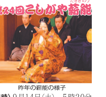
今年の新作の様子