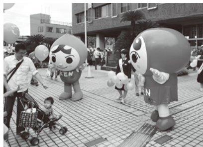
イメージキャラクターの人KENまもる君とあゆみちゃんは各種イベントに登場します