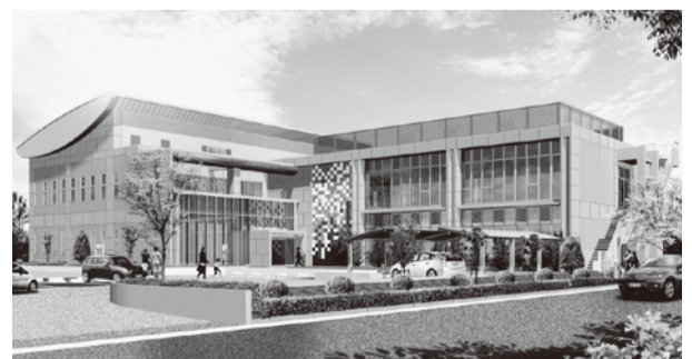
出羽地区センター・公民館完成イメージ