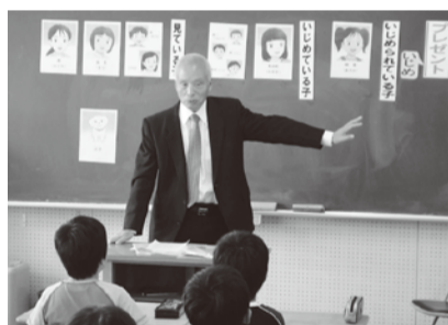
毎年人権擁護委員が小学校で人権について話をしています

人権擁護委員は、人権擁護委員法により法務大臣から委嘱される民間人で、現在、全国では約1万4000人、本市では8人が活動しています。市では、越谷人権擁護委員協議会越谷支部と連携し、事業を行っています。 人権相談 人権擁護委員が市民の皆さんから人権に関する相談を受け、問題解決の支援をしています。心配ごとがありましたら、お気軽にご相談ください。相談は無料です。相談料は不要です。相談所の開設日時に直接会場までお越しください(15面人権相談参照)。 子どもの人権SOSミニレター 小・中学校の児童・生徒を対象とした手紙による人権相談で、人権擁護委員が回答しています。