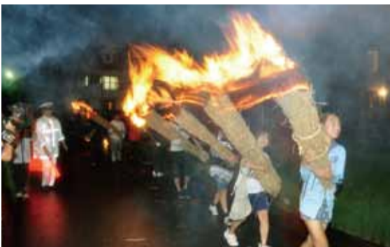
今では県内で唯一残る虫追い

新方地区の北川崎で虫追いが行われました。これは、江戸時代から続く農村行事で、毎年7月24日に行われています。麦わらで作ったたいまつに火をつけ、その炎と煙で稲につく害虫を追い払い、その年の豊作を祈願します。午後7時に川崎神社を出発。全長約2キロほどのコースを「稲の虫、ホイホイ」の呼び声に合わせて練り歩きました。子どもたちは、自分の身長以上のたいまつを持って参加し、「たいまつを初めて持ちました。重くて、熱くて、煙が目にしみるけど、とても楽しいです」と笑顔で話していました。