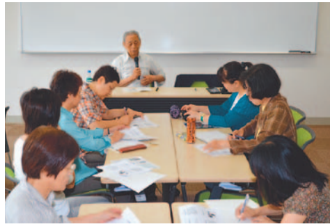
グリーンカウンセリング入門講座の様子