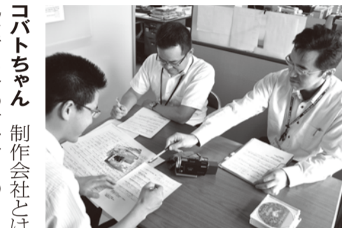
毎月企画会議を行います

コバトちゃん 今回は、25年6月号で紹介した「広報紙(お知らせ版)」ができるまでの続編で、「テレビ広報番組(いきいき越谷)」ができるまでを紹介するわ。