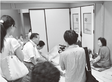
避難所を回る高橋市長(9月2日)