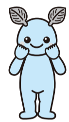
ハッポちゃんも「けんこう大使」として出演します

10月12日(日) 午前9時~午後0時30分 会場: イオンレイクタウンmori 1階「水の広場」 内容: 埼玉県東部の市町による特定健診の受診促進キャンペーン。 費用: 無料