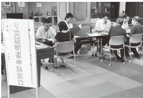
り災証明出張受付(くすのき荘)