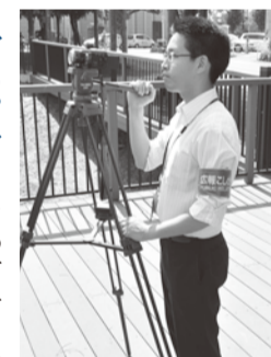
撮影は制作会社と広報広聴課職員が行います

がないかなどに注意しながら校正するの。広報紙と同じね。 コバトちゃん 次のロケーション撮影って、なに？ キク姉さん 現在の風景や場所、店舗などを利用して行う撮影のことをロケーション撮影と言わ。よくロケって言われているものよ。いきいき越谷の特集企画では、レポーターが現地へ行って市内のさまざまな施設やできごとを紹介したり、インタビューを行ったたりしているわ。