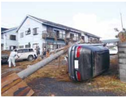
▶横転する乗用車(砂原地区)

◆家屋の被害 全壊24世帯、大規模半壊45世帯、半壊109世帯、一部破損1200世帯(9月24日現在)