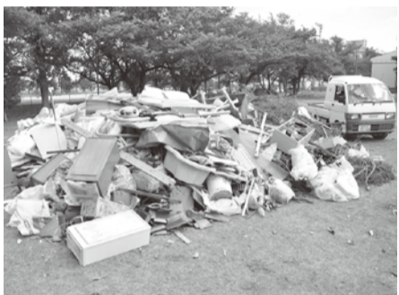
集められたがれき(大杉公園)

9月18日 家庭ごみの集積所への分別排出や家屋解体ごみの個人搬入の受け付けを開始