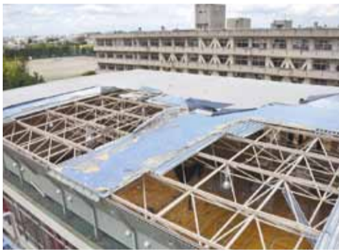
▶破損した体育館屋根(北陽中学校)

2面には竜巻関連の詳細情報、16面には被災された方への主な支援情報を掲載しています