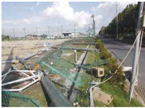
▶倒壊した防球ネット支柱(しらこぼと運動公園)