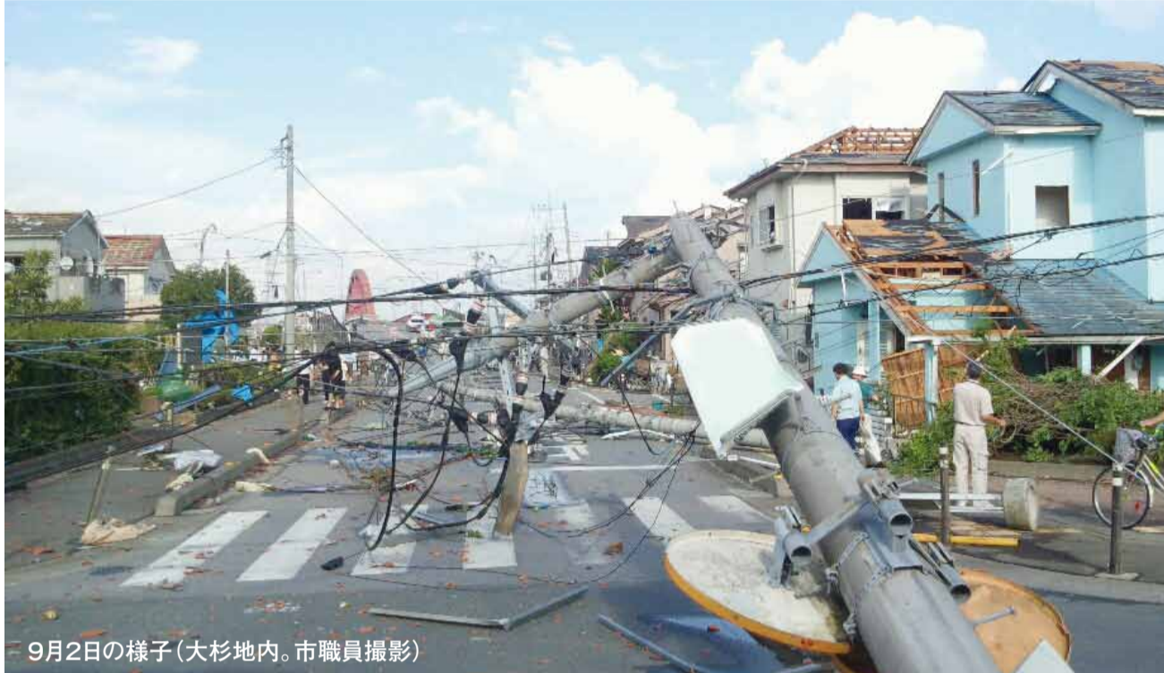
9月2日の様子(大杉地内。市職員撮影)

発行/越谷市 ☎343-8501 埼玉県越谷市越ヶ谷4-2-1 ☎964-2111(代表) ☎965-6433 www.city.koshigaya.saitama.jp *広報紙は市ホームページからもご覧になれます 編集/広報広聴課