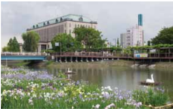
今年の見ごろは終わりました。来年をお楽しみに

ハナシヨウブは、平和橋を中心に、上流側約220坪に約3000株、下流側約220坪に約3300株が植えられ、種類は江戸系の「峰紫」や肥後系の「瑞穂の国」など30種類。濃紫や淡い藤色、ぼかしなど色や形もさまざまなハナシヨウブが優雅に揺れていました。また、今年市内造園関係者の計らいで、ハナシヨウブのいかだや白鳥のオブジェが登場、「水郷こしがや」の景観に彩りを添えました。