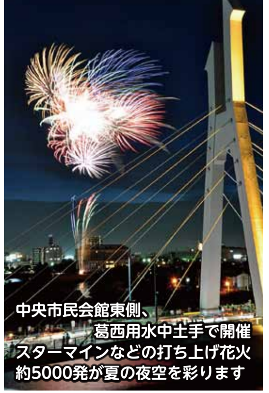
中央市民会館東側、葛西用水中土手で開催 スターメインなどの打ち上げ花火 約5000発が夏の夜空を彩ります

入のうえ郵送してください *「給付金のお知らせ」は各公共施設にあるほか、市ホームページにも掲載しています 〈対象者〉 ▽臨時福祉給付金:平成26年度の市民税(均等割)が非課税の方(課税されている方の扶養親族や生活保護を受給中の方等は対象外)