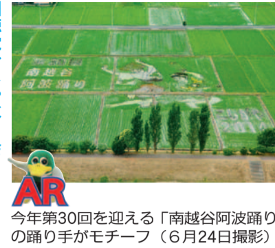
今年第30回を迎える「南越谷阿波踊り」の踊り手がモチーフ(6月24日撮影)