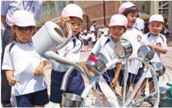
じょうろの水で水車が回ると電気が起きるんだ!

6月9日、大袋幼稚園で太陽光発電体験教室「太陽光で遊ぼう」が開催されました。これは、今年2月に市民の寄付と県の補助金で園内に太陽光発電設備「大袋ひかひかソーラーファーム」が開設されたことに伴い、設備の導入を行ったNPO法人の協力により行ったものです。