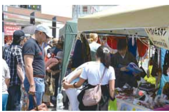
どのブースも多国籍の人であふれました

これまでは多文化フェスタとして、中央市民会館で開催していましたが、市内の高校生や大学生も参加し、初めて屋外での開催となりました。外国料理や雑貨の販売、外国の文化紹介、ステージ発表など多彩なプログラムで交流が行われ、会場は多数の老若男女でにぎわいました。