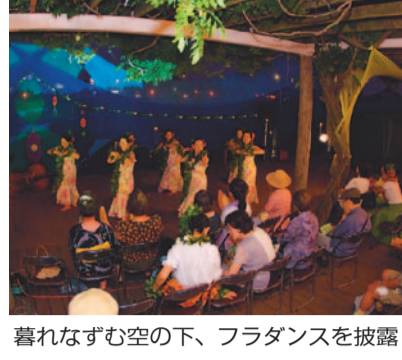
喜れなずむ空の下、フラダンスを披露