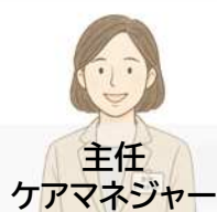
主任 ケアマネジャー