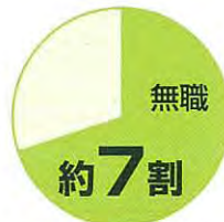
再入受刑者に占める無職者の割合