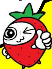
ストロングベリーちゃん©