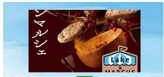
ブラウンマルシェ〜レイク&マルシェ開催 (3/17)

埼玉の海ともいえる「レイクタウン」の港をイメージしたポータルサイト「ポート」。イベント登録などは事業者自身ができる仕組みを取り入れ、管理運営を効率的に行いつつ、地域の人々が求める情報発信ができるプラットフォームになりました。