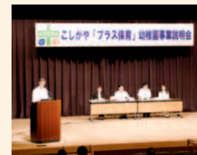
来場者の質問に市職員が答えました