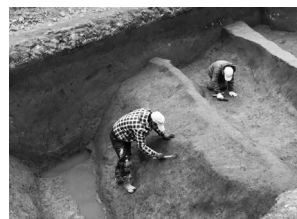
奈良時代の土器が出土した溝

報告書は令和8年3月末に完成したばかりですので、現在、図書館・図書室で閲覧・貸し出しができるよう準備をしています。また、全国の発掘調査報告書をインターネット上で読むことができる「全国文化財総覧」でも公開します。（サイトにアクセスし、「越谷市 西口遺跡」で検索してください。下記の二次元コードからもサイトにアクセスできます。なお『西口遺跡発掘調査報告書1』はすでに公開されています。）