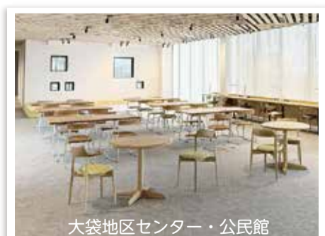
大袋地区センター・公民館