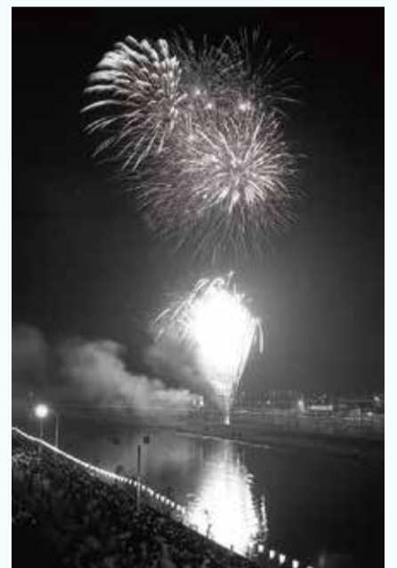
昭和48年8月5日 納涼花火大会

掲載した写真は、昭和47年の「納涼花火大会」のもの。集まった多くの方が、夜空を見上げる熱気が伝わってくるようです。提灯の明かりや、川面にゆらゆらと反射する光の筋…。モノクロ写真ながら、当時の音や火薬の匂いまでもが蘇ってくる気がしませんか? デジタルアーカイブで「花火」や「祭り」と検索すると、こうした貴重な一瞬が数多く公開されています。