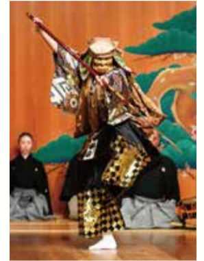
能「熊坂」より