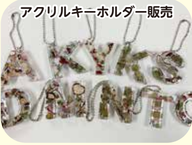
アクリルキーホルダー販売

目の前で魔法を体験してみよう！ 時 間 ①10:20～11:00、②11:30～12:10、③12:40～13:20、 ④13:50～14:30 定 員 各回20人 参加費 無料