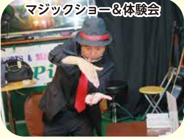
マジックショー&体験会

目の前で魔法を体験してみよう！ 時 間 ①10:20～11:00、②11:30～12:10、③12:40～13:20、 ④13:50～14:30 定 員 各回20人 参加費 無料