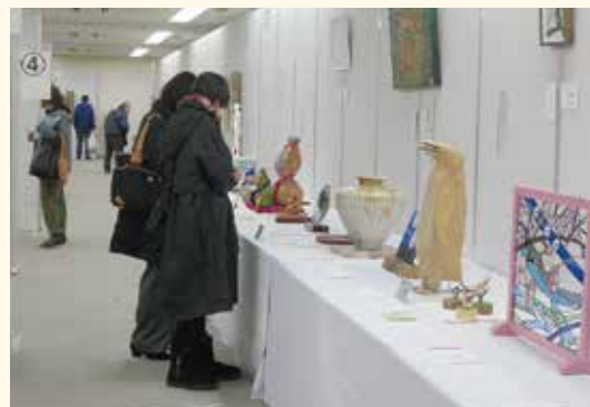
材料や作り方が気になる工芸作品