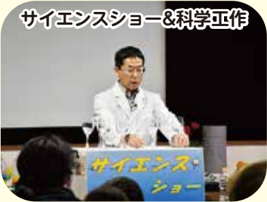
サイエンスショー&科学工作

タイルの上にお絵かき♪ 下絵の上に樹脂液を混ぜた絵の具で色をつけて作品を作ります。 時 間 ①10:15～11:30 ②12:00～13:15 定 員 各回25人(先着) 参加費 300円