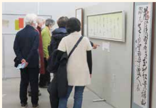
なんて書いてあるのかな…？

問合せ 第24回越谷市美術展覧会実行委員会 (越谷市教育委員会 生涯学習課内) ☎963-9307