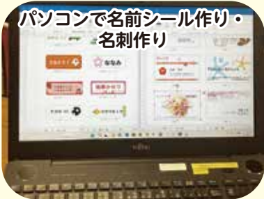
パソコンで名前シール作り・ 名刺作り

共 催 越谷市生涯学習推進会・越谷市・越谷市教育委員会 問合せ 生涯学習課 ☎963-9283