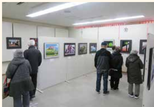
輝く一瞬を捉えた写真の数々