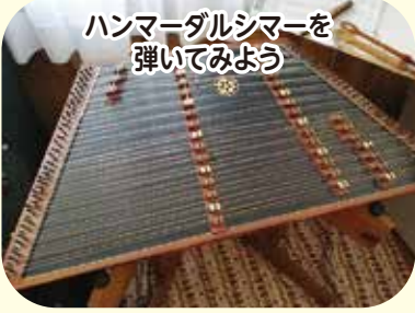
ハンマールシマーを 弾いてみよう

こんな楽器、知っていますか？ 弦をバチで叩いて奏でる「ハンマールシマー」。神秘的で美しい音色を楽しんだら、実際に自分でも弾いてみよう。