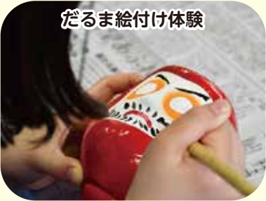
だるま絵付け体験

わくわく楽しい科学の世界へご案内☆ 時 間 ①サイエンスショー 10:15～11:00 ②科学工作11:15～12:00 参加費 無料