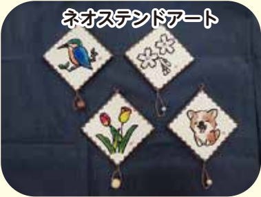
ネオステンドアート

木を削って自分のお箸を作ろう！ 時 間 ①10:30～11:30、②12:30～13:30、③14:00～15:00 定 員 各回小学生12人(先着) ※小学1～3年生は保護者同伴 参加費 無料