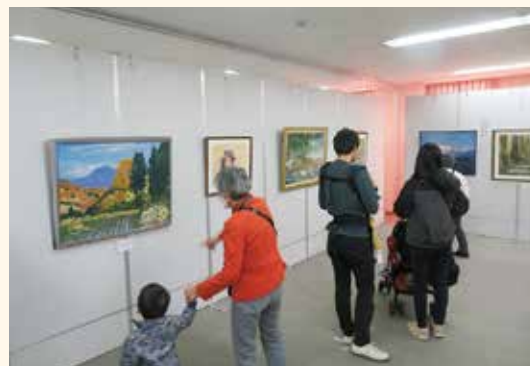
老若男女問わず楽しめます