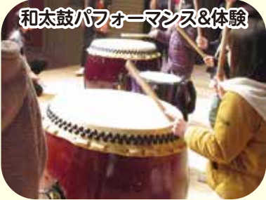
和太鼓パフォーマンス&体験

越谷市の伝統工芸に触れてみよう♪ 時 間 ①10:15～、②13:15～(所要 時間15～30分程度。時間内で 随時入替) 定 員 各回45人(先着) 参加費 500円