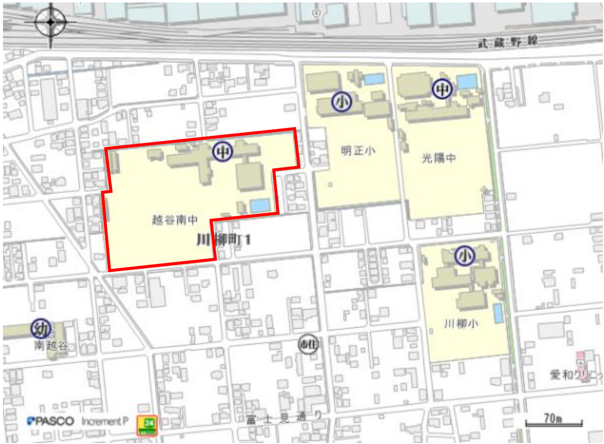
図 3 事業予定地（川柳）