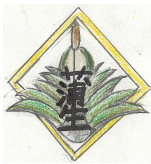
原作者 笹嶋 大雅さん(蒲生小学校5年)