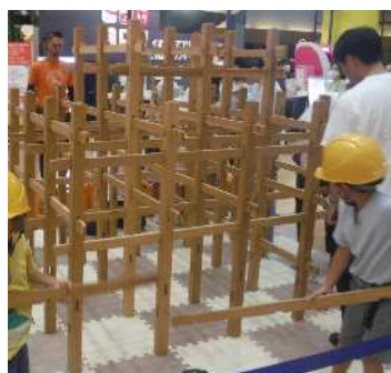
(エコウィークイベント)

公共施設の備品購入などによる埼玉県産・国産材の利用、木育事業の実施、埼玉県産・国産材を利用した普及啓発品の購入などを実施していく。