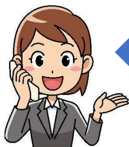
コールセンター (通訳者)