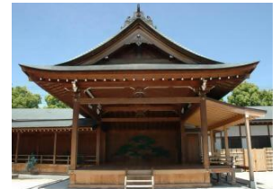
Nhà hát Noh Koshigaya

Ngày hôm đó khi đến tham gia hãy đeo khẩu trang, mặc quần áo dễ vận động. Không được tham dự nếu sốt trên 37.5° hoặc có triệu chứng của cảm cúm.