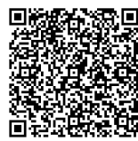
简明日语版、英语版 中文版、越南语版