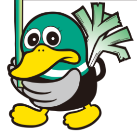
越谷特別市民 ガーヤちゃん