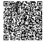
にほんごばん えいごばん やさしい日本語版・英語版・ ちゅうごくごばん 中国語版・ベトナム語版