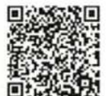
きゅうきゆうそうだん AI 救急相談