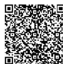
総合防災ガイドブック