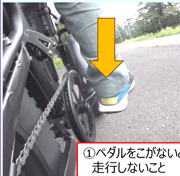
①ペダルをこがないと走行しないこと