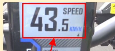
24km/hを超えても継続してアシストしました