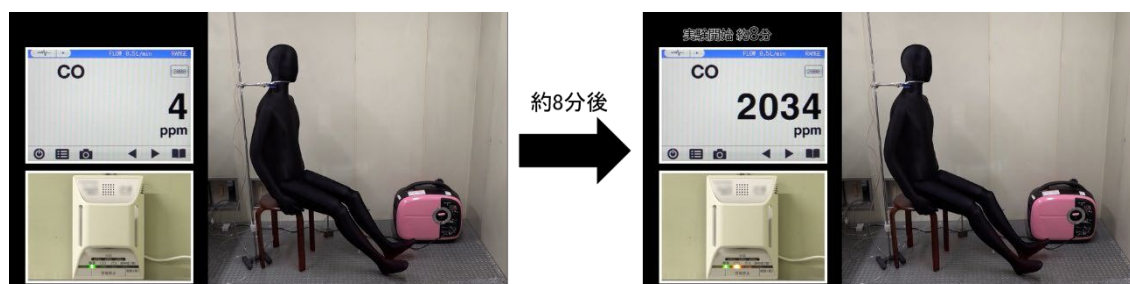
図2 室内で携帯発電機を使用した際の一酸化炭素（CO）濃度の変化