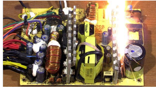
図5 浸水による通電火災のイメージ

(水に濡れた電気製品の内部には、水分が残っていたり、泥や塩分などの異物が付着していたりすることがあるため、通電時に電気回路基板から発火するおそれがある。)