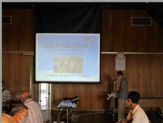
第5回協議会の様子（視察報告）

これらのご意見をもとに、班に分かれて広場の方向性について意見交換し、最後に各班から発表することで、協議会で意見を共有しました。