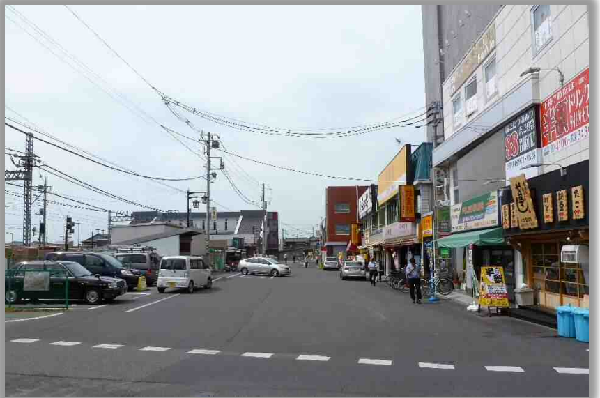
大袋駅東口の様子