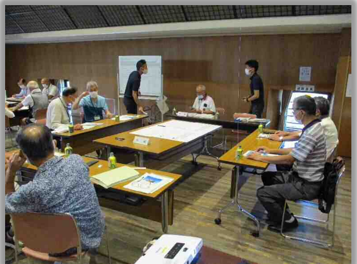
第5回協議会の様子（意見交換）