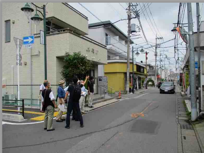
既存のアクセス道路を視察する様子（一ノ割駅）

「五反野駅前交通広場」は、駅の乗降人員は大袋駅の2倍近いものの、整備された広場の形状や大きさが比較的小さく、大袋駅東口でも想定される広場に近いものと思われることや、地元のみちづくり協議会においても、広場の整備について協議を行っていたことから視察しました。この広場については、足立区役所密集地域整備課の職員の方々にご協力いただき、駅前広場の整備内容や経緯等について、ご説明をいただきました。