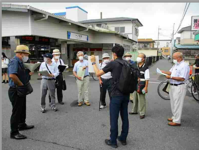
駅前広場視察の様子（一ノ割駅）

また、国道4号から駅前までの既存のアクセス道路について、電柱が民地に移設され広がった道路を歩いて確認しました。