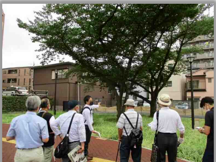
駅前広場視察の様子（五反野駅）