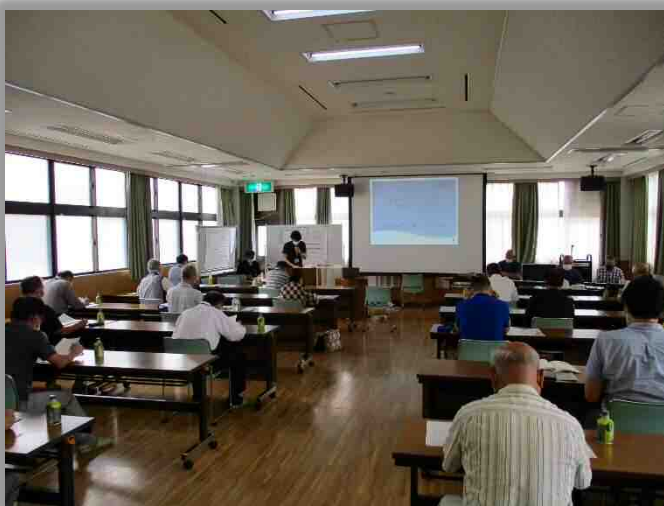
第4回協議会の様子（大袋北交流館）