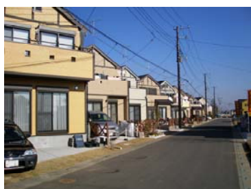
地区計画による魅力ある街並み（西大袋地区）