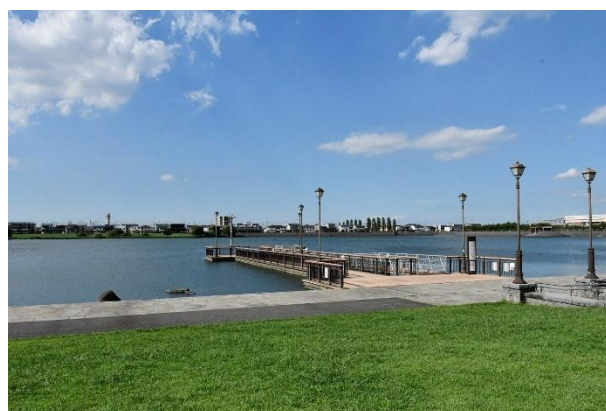
越谷レイクタウン

平成27年には「中核市」へ移行し、現在は、第5次越谷市総合振興計画に基づき、本市の将来像「水と緑と太陽に恵まれた みんなが活躍する安全・安心・共生都市」を目指してまちづくりを進めています。