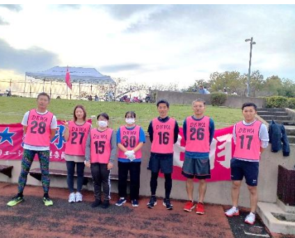
▲大玉ころがしの選手の皆さん