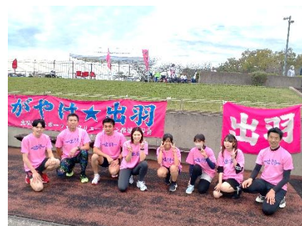
▲地区対抗リレーの選手の皆さん