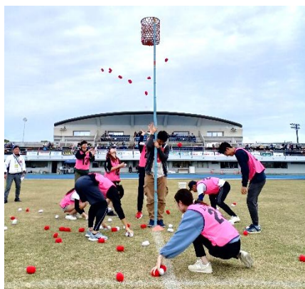
▲紅白玉入れの選手の皆さん